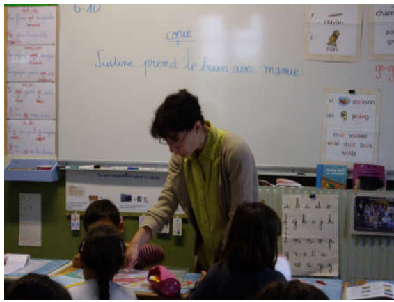
Cycle 2 – CE2